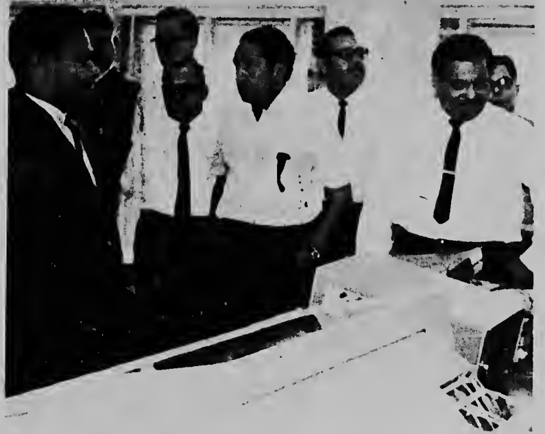
Masha atencion e miembronan di Bestuurscollege y Eilandsraad a mustra ayera mainta pa e splicacionnan cu a ser duna encuanto e computer nobo cu gobierno a laga instala den e Departamento Central di Administracion mecanico, cual anteriormente tabata ser yama Tabuleerdienst.

nos a nanja tende, cu nan ta sinja den un ambiente agradable, nan por puntra tur locual nan no ta componde, y cada uno ta pensa cu aki un paar di luna e ta kla pa drenta comunidad como un mesla of un carpinte.